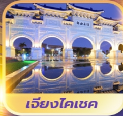
เจียงโคเซค