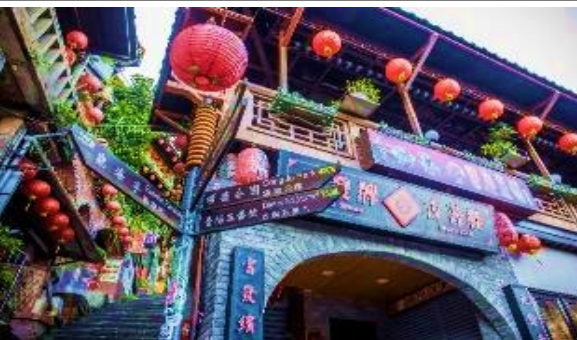
การขึ้นหมู่บ้านจิวเฟิน ** เสาร์-อาทิตย์ต้องเปลี่ยนเป็นรถสาธารณะ **

นำท่านเดินทางไปยังสัมผัสบรรยากาศ ถนนเก๋าจิวเฟิน ที่ตั้งอยู่บริเวณไหล่เขาในเมืองจีหลง เคยเป็นแหล่งเหมืองทองที่มีชื่อเสียงตั้งแต่สมัยโบราณ ปัจจุบันเป็นสถานที่ท่องเที่ยวที่สำคัญแห่งหนึ่ง เพราะเป็นถนนคนเดินเก๋าก๊ากที่มีชื่อเสียงที่สุดในไต้หวัน ให้ท่านได้เพลิดเพลินบรรยากาศแบบดั้งเดิมของร้านค้า ร้านอาหารของชาวไต้หวันในอดีตและสามารถชื่นชมวิวทิวทัศน์ได้