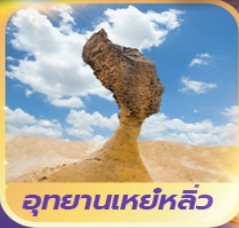
อุทยานเหยหลิว