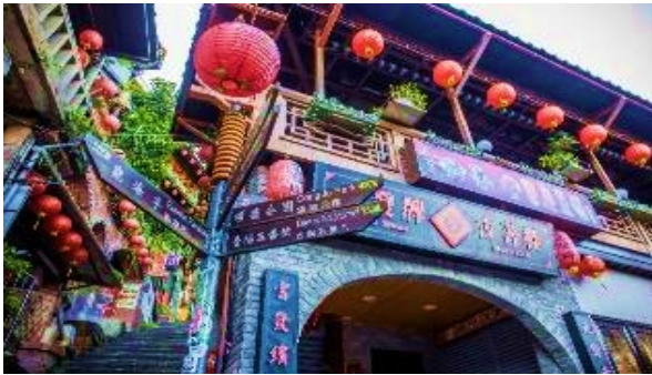
การขึ้นหมู่บ้านจิวเฟิน ** เสาร์-อาทิตย์ต้องเปลี่ยนเป็นรถสาธารณะ **

นำท่านเดินทางไปสัมผัสบรรยากาศ ถนนเก่าจิวเฟิน ที่ตั้งอยู่บริเวณไหล่เขาในเมืองจีหลง เคยเป็นแหล่งเหมืองทองที่มีชื่อเสียงตั้งแต่สมัยโบราณ ปัจจุบันเป็นสถานที่ท่องเที่ยวที่สำคัญแห่งหนึ่ง เพราะเป็นถนนคนเดินเก่าแก่ที่มีชื่อเสียงที่สุดในไต้หวัน ให้ท่านได้เพลิดเพลินบรรยากาศแบบดั้งเดิมของร้านค้า ร้านอาหารของชาวไต้หวันในอดีตและสามารถชื่นชมวิวทิวทัศน์ได้