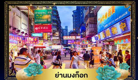
ย่านมงก๊ก