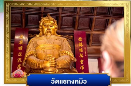
วัดแซงหนุ๊ง