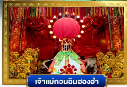
เจ้าแม่กวนอิมสองห้า