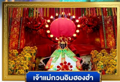
เจ้าแม่กวนอิมสองห้า