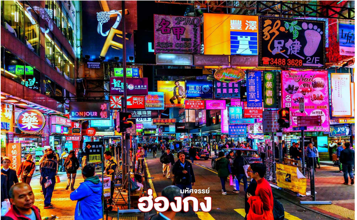
บทสำรวจ ฮ่องกง

มากมาย ภายในย่านมีตลาดนัด Ladies' Market ขนาดใหญ่ซึ่งมีร้านขายเสื้อผ้า และของ กระจุกกระจิกให้ได้เลือกซื้อมากมาย