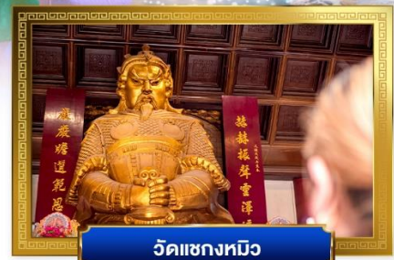
วัดแซงหนุก