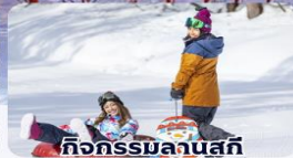
กิจกรรมลานสกี