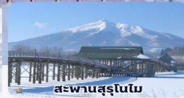
สะพานสุรุโนโม