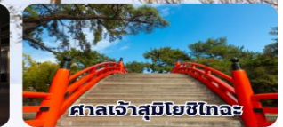
ศาลเจ้าสุมิโยชิโตะ