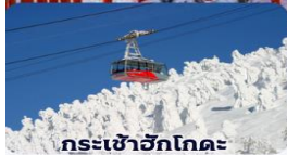
กระเช้าอีกโกดะ