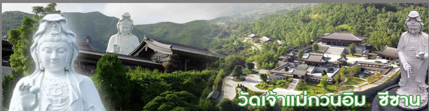
วัดเจ้าแม่กวนอิม ชีซาน

วัดชีซาน หลายคนที่เคยไปเที่ยวฮ่องกงมาแล้ว อาจจะยังไม่เคยเยือนวัดชีซาน หรือ Tsz Shan Monastery เป็นวัดที่มีเจ้าแม่กวนอิมองค์ใหญ่เป็นอันดับสองของโลก มีความสูงถึง 76 เมตร ตั้งอยู่บนเนื้อที่กว่า 29 ไร่ ในเกาะฮ่องกง โดยมีนายลีกาซิง มหาเศรษฐีชื่อดังของฮ่องกง บริจาคเงินสร้างวัดถึง 193 ล้านดอลลาร์เลยทีเดียว