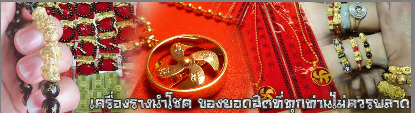
เครื่องรางนำโชค ของยอดฮิตที่ทุกท่านไม่ควรพลาด

จากนั้นนำท่านสู่ ร้านหยก ชมความงามปีเซียะ ที่เชื่อกันว่าเป็นวัตถุมงคลยอดนิยม ที่มีการนำมาบูชา เพื่อให้ช่วยป้องกันสิ่งชั่วร้าย เรียกทรัพย์สินเงินทองให้ไหลมาเทมา และกักเก็บทรัพย์นั้นไม่ให้รั่วไหลออกไปไหนได้ ชาวจีนโบราณเชื่อกันว่า ปีเซียะเป็นสัตว์ประหลาดที่รวมลักษณะของสัตว์มงคลทั้ง 5 ชนิดไว้ด้วยกัน ได้แก่ มังกร พญาราชสีห์หรือสิงโต, อินทรี, กวาง, และแมว โดยตามตำนานเล่าว่า ปีเซียะเป็นลูกมังกรตัวที่ 9 (เทพแห่งโชคลาภ) ของพญามังกรสวรรค์ มีชื่อเรียกด้วยกันหลายชื่อไม่ว่าจะเป็น “เทียนลก (กวางสวรรค์)” เป็นชื่อเดิม ส่วนจีนกวางตุ้งจะเรียกว่า “เผ่ฮ่า” และคนจีนแต้จิ๋วจะเรียกว่า “ผีซิว”