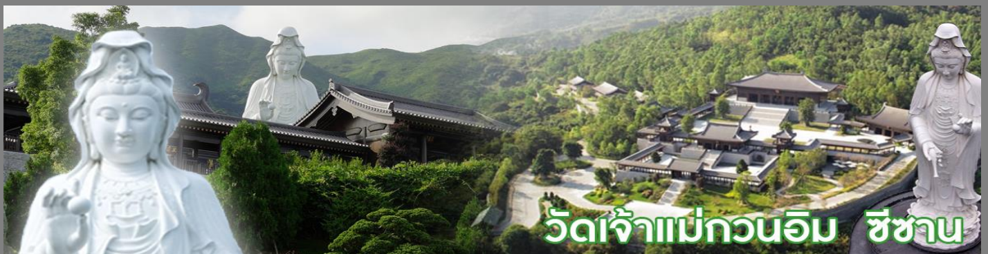
วัดเจ้าแม่กวนอิม ชีซาน

วัดชีซาน หลายคนที่เคยไปเที่ยวฮ่องกงมาแล้ว อาจจะยังไม่เคยเยือนวัดชีซาน หรือ Tsz Shan Monastery เป็นวัดที่มีเจ้าแม่กวนอิมองค์ใหญ่เป็นอันดับสองของโลก มีความสูงถึง 76 เมตร ตั้งอยู่บนเนื้อที่กว่า 29 ไร่ ในเกาะฮ่องกง โดยมีนายลีกาซิง มหาเศรษฐีชื่อดังของฮ่องกง บริจาคเงินสร้างวัดถึง 193 ล้านดอลลาร์เลยทีเดียว