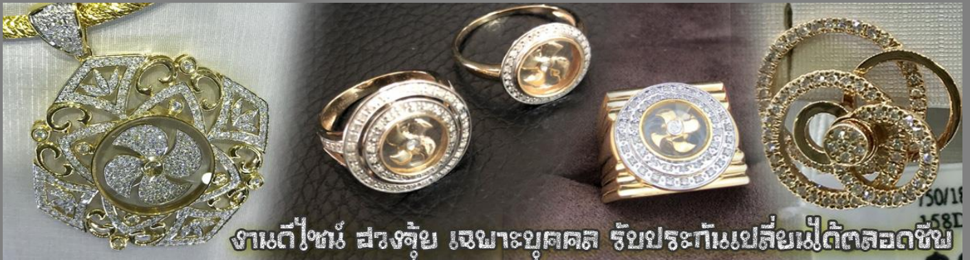
งานดีไซน์ สร่งตุ้ย เฉพาะบุคคล รับประกันเปลี่ยนเม็ดตลอดชีพ

นำท่านเยี่ยมชม โรงงานจิวเวลรี่ ที่ขึ้นชื่อของฮ่องกงพบกับงานดีไซน์ที่ได้รับรางวัลอันดับยอดเยี่ยม และใช้ในการเสริมดวงเรื่อง ฮวงจุ้ยนำความโชคดี มั่งคั่งแก่ผู้สวมใส่ ซึ่งในเมืองไทยก็ได้นิยมแพร่หลายออกไป ไม่ว่าจะเป็นกลุ่ม ดารา นักการเมือง พ่อค้าแม่ขายที่ประกอบธุรกิจ เจ้าของกิจการห้างร้านต่าง ๆ ซึ่งเชื่อกันว่าจะนำสิ่งดี ๆ ปัดเป่าสิ่งชั่วร้ายให้กับบุคคลที่สวมใส่ ซึ่งจะมีมากมายหลายชนิด เช่น จี้กั๊กหัน แหวนรูปต่าง ๆ นาฬิกาข้อมือ (ซึ่งผู้สวมใส่จะได้รับการดูอายุมือจากซินเซปประจำร้าน เพื่อนำวิธีการเสริมดวงในการสวมใส่โดยไม่ติดต่อบริการ)