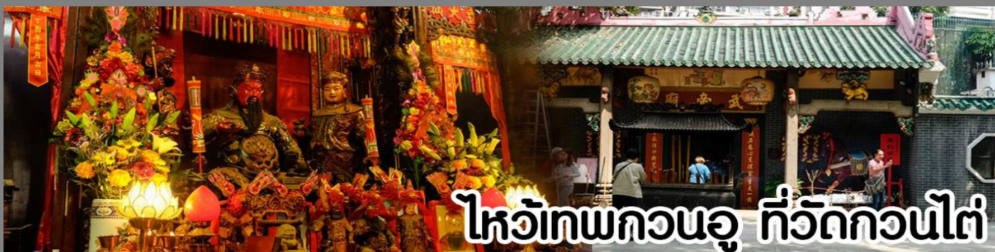
ไหว้เทพกวนอู ที่วัดกวนไต่

หลังจากนั้นขอพรเทพเจ้ากวนอู ณ วัดกวนไต่ วัดเก่าแก่สร้างขึ้นในปีพ.ศ. 2434 เป็นวัดเดียวในเกาะลูนที่บูชาเทพ เจ้ากวนอูเป็นเทพผู้ยิ่งใหญ่ เทพเจ้าแห่งความซื่อสัตย์ โชคลาภ บารมี