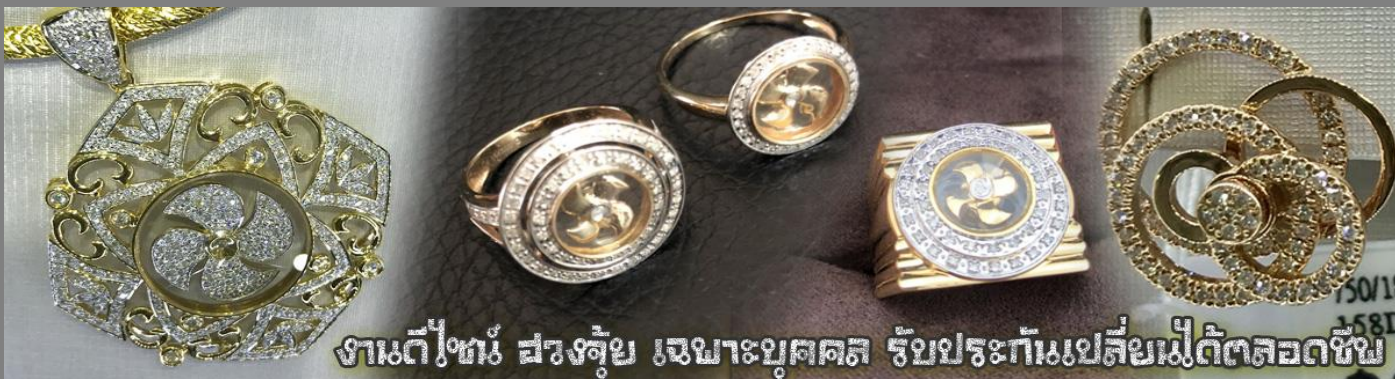
งานดีไซน์ สรรงชุ่ย เฉพาะบุคคล รับประกันเปลี่ยนเม็ดได้ตลอดชีพ

นำท่านเยี่ยมชม โรงงานจิวเวลรี่ ที่ขึ้นชื่อของฮ่องกงพบกับงานดีไซน์ที่ได้รับรางวัลอันดับยอดเยี่ยม และใช้ในการเสริมดวงเรื่อง ฮวงจุ้ยนำความโชคดี มั่งคั่งแก่ผู้สวมใส่ ซึ่งในเมืองไทยก็ได้นิยมแพร่หลายออกไป ไม่ว่าจะเป็นกลุ่ม ดารา นักการเมือง พ่อค้าแม่ขายที่ประกอบธุรกิจ เจ้าของกิจการห้างร้านต่าง ๆ ซึ่งเชื่อกันว่าจะนำสิ่งดี ๆ ปัดเป่าสิ่งชั่วร้ายให้กับบุคคลที่สวมใส่ ซึ่งจะมีมากมายหลายชนิด เช่น จี้กั๊ก หัน แหวนรูปต่าง ๆ นาฬิกาข้อมือ (ซึ่งผู้สวมใส่จะได้รับการดูอายุมือจากซินเซปประจำร้าน เพื่อนำวิธีการเสริมดวงในการสวมใส่โดยไม่ติดต่อบริการ)