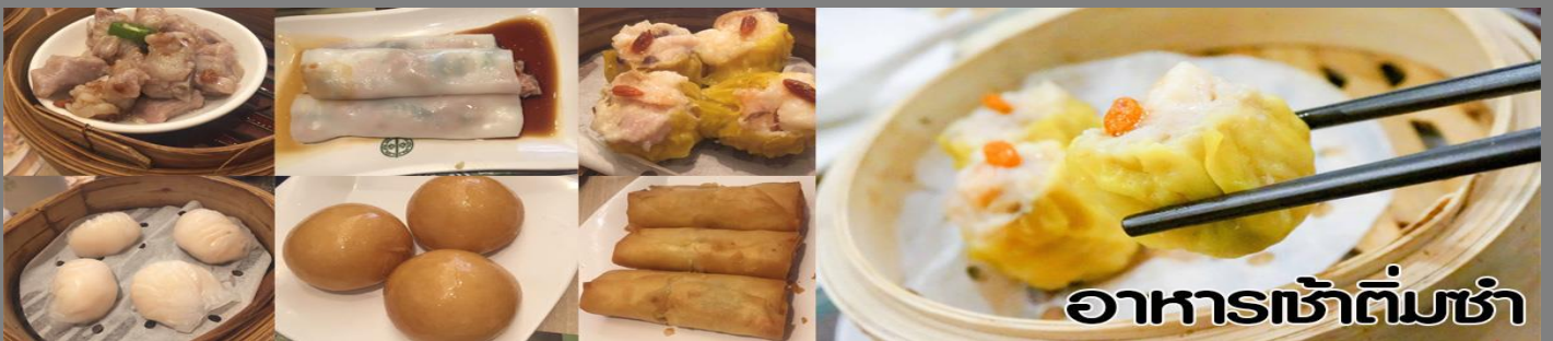
อาหารเช้าต้มซ่า

นำท่านไปไหว้ เจ้าแม่กวนอิมสงฮำ (Kun Im Temple Hung Hom) เป็นวัดเจ้าแม่กวนอิมที่มีชื่อเสียงแห่งหนึ่งในฮ่องกง ขอพรเจ้าแม่กวนอิมพระโพธิสัตว์แห่งความเมตตา ช่วยคุ้มครองและปกป้องรักษาวัดเจ้าแม่กวนอิมที่ Hung Hom หรือ “Hung Hom Kwun Yum Temple” เป็นวัดเก่าแก่ของฮ่องกงสร้างตั้งแต่ปี ค.ศ. 1873 ถึงแม้จะเป็นวัดขนาดเล็กที่ไม่ได้สวยงามมากมาย แต่เป็นวัดเจ้าแม่กวนอิมที่ชาวฮ่องกงนับถือมาก แทบทุกวันจะมีคนมาบูชาขอพรกันแน่นวัด ถ้าใครที่ชอบเสียงเซียมซี เขาบอกว่าที่นี่แม่นมากที่พิเศษกว่านั้น นอกจากสักการะขอพรแล้วยังมีพิธีขอของอั้งเปาจากเจ้าแม่กวนอิมอีกด้วย ซึ่งคนส่วนใหญ่จะนิยมไปโบสถ์กลางตรุษจีนเพราะเป็นศิริมงคลในเทศกาลปีใหม่ ซึ่งทางวัดจะจำหน่ายอุปกรณ์สำหรับเช่นไหว้พร้อมของแดงไว้ให้ผู้มาขอพร เมื่อสักการะขอพรโชดลากแล้วก็นำของแดงมาวนเหนือกระถางรูปหน้าองค์เจ้าแม่กวนอิมตามเข็มนาฬิกา 3 รอบ และเก็บของแดงนั้นไว้ซึ่งภายในซองจะมีจำนวนเงินที่ทางวัดจะเขียนไว้มากน้อยแล้วแต่โชด ถ้าหากเราประสบความสำเร็จเมื่อมีโอกาสไปฮ่องกงอีกก็ต่อยกลับไปทำบุญ ช่วงเทศกาลตรุษจีนจะมีชาวฮ่องกงและนักท่องเที่ยวไปสักการะขอพรกันมากขนาดต้องต่อแถวยาวมาก คนที่ไม่มีเวลาก็สามารถใช้เวลาอื่น ๆ ตลอดทั้งปีเพื่อขอของแดงจากเจ้าแม่กวนอิมได้เช่นกัน โดยซื้ออุปกรณ์เช่นไหว้จากทางวัดเพียงแต่ควรเตรียมของแดงไปเอง (ในกรณีกับทางวัดไม่ได้เตรียมของแดงไว้ให้เนื่องจากไม่ได้อยู่ในหน้าเทศกาล) แล้วก็ใส่ธนบัตรตามฐานะและศรัทธา เขียนจำนวนเงินที่ต้องการลงไปด้วย ใส่สกุลเงินยิ่งดีใหญ่ แล้วก็ไหว้ด้วยพิธีเดียวกัน ถ้าประสบความสำเร็จตามที่มุ่งหวังต่อยกลับมาทำบุญที่นั่นโอกาสหน้า