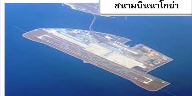
สนามบินนาโกย่า

เวลา 00.05 น. ออกเดินทางสู่ สนามบินนาโกย่า ประเทศญี่ปุ่น โดยสายการบินไทย เที่ยวบินที่ TG 682