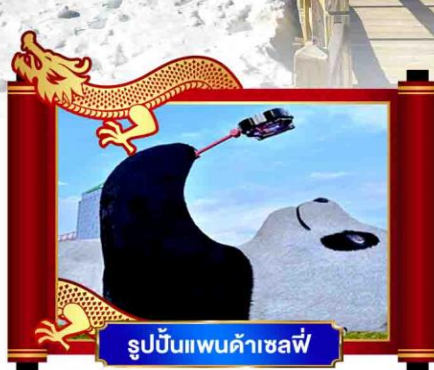
รูปปั้นแพนด้าเซลฟี่