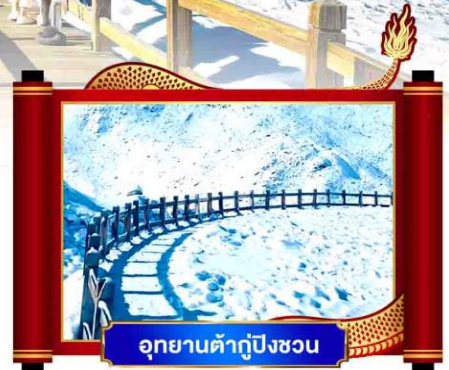
อุทยานต้ากู่ปิงชว่น