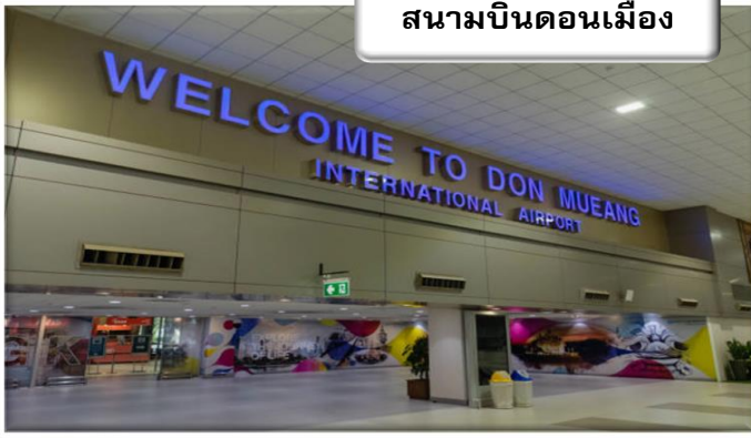
สนามบินดอนเมือง

เวลา 23.30 น. พร้อมกันที่ สนามบินดอนเมือง อาคารผู้โดยสารขาออกระหว่างประเทศเคาน์เตอร์ สายการบินไทยแอร์เอเชีย เอ็กซ์ เจ้าหน้าที่คอยให้การต้อนรับ ดูแลด้านเอกสาร เช็คอิน และสัมภาระในการเดินทาง