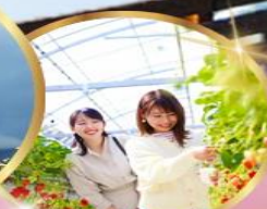
บุฟเฟต์ สดอบอร์ เก็บสดจากต้น