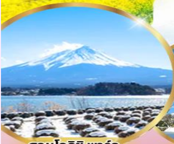
สวนโออิชิ พาร์ค