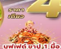
บุฟเฟต์ ซาปู 1 มื้อ