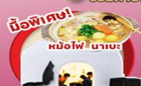
มือพิเศษ!