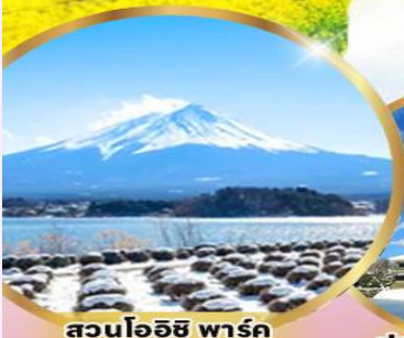
สวนโออิชิ พาร์ค