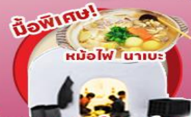
มือพิเศษ!