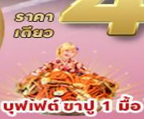
บุฟเฟต์ ซาปู 1 มื้อ