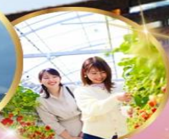
บุฟเฟต์ สดอเบอร์ เก็บสดจากต้น