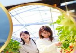
บุฟเฟต์ สดอเบอร์ เก็บสดจากต้น