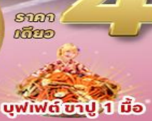
บุฟเฟต์ ซาปู 1 มื้อ