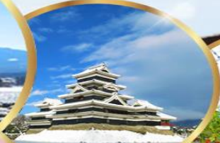
ปราสาทมัตสึโมโตะ