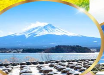
สวนโออิชิ พาร์ค