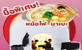
มือพิเศษ!