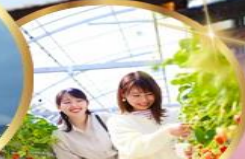
บุฟเฟต์ สดอเบอร์ เก็บสดจากต้น