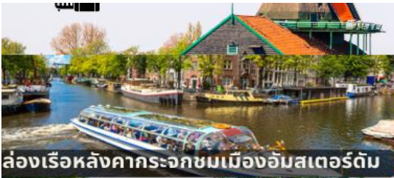
ล่องเรือหลังคากระจกชมเมืองอัมสเตอร์ดัม