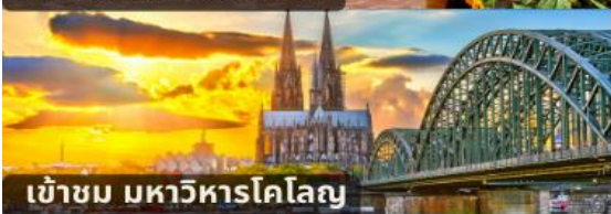
เข้าชม มหาวิหารโคโลญ