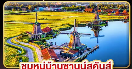
ชมหมู่บ้านชานส์คินส์