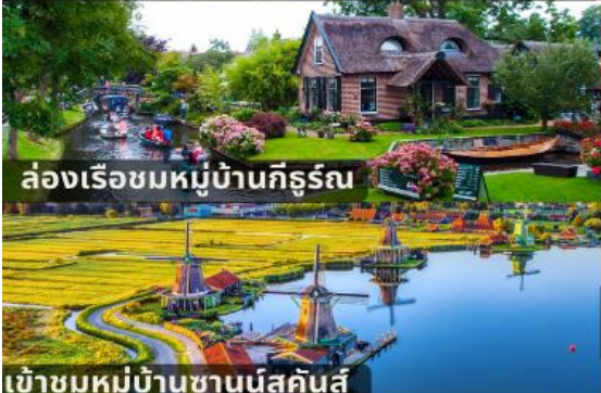
ล่องเรือชมหมู่บ้านกีทซ์บูร์ล