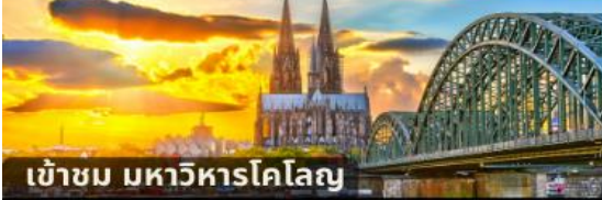
เข้าชม มหาวิหารโคโลญ