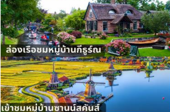
ล่องเรือชมหมู่บ้านกิวร์ธ