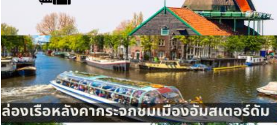
ล่องเรือหลังคากระจกชมเมืองอัมสเตอร์ดัม