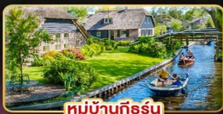
หมู่บ้านกีร์ธึน