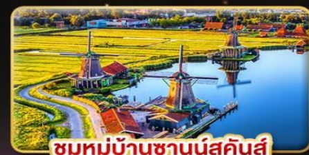
ชมหมู่บ้านชานน์สคินส์