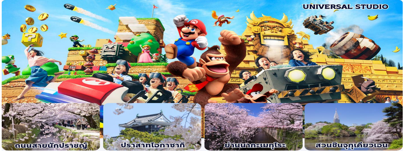
ถนนสายนักปราชญ์

📍 เกียวโต-โอซาก้า-นาโงย่า-ชิซุโอกะ-ยามานาชิ-โตเกียว