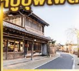
เมืองเก่าซาวาระ