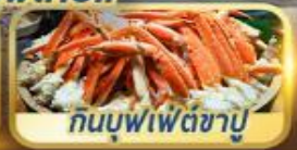
กินบุฟเฟ่ต์ซาบู