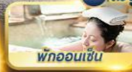
พักผ่อนเซ็น