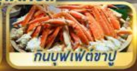
กินบุฟเฟ่ต์ชาบู