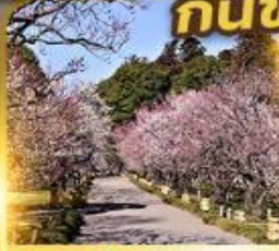
สวนไคราคูเอิน