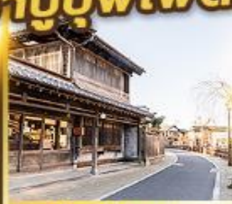
เมืองเก่าซาวาระ