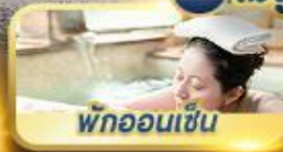
พักออนเซ็น