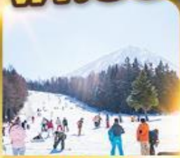
ลานสกีฟุจิกัน