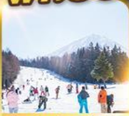
ลานสกีฟุจิกัน