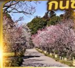
สวนไคราคูเอิน