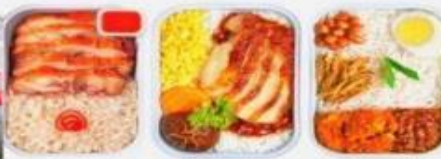
บริการอาหารร้อน ทั้งขาไป-ขากลับ