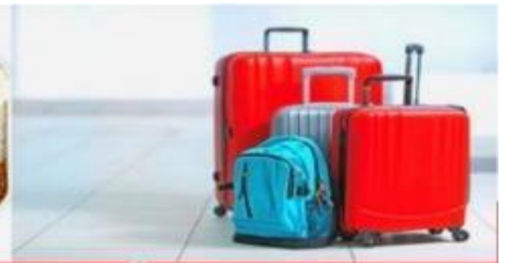
น้ำหนักกระเป๋า สูงสุด 20 กก.