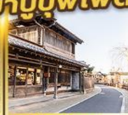
เมืองเก่าซาวาระ