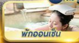
พักออนเซ็น