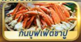
กินบุฟเฟ่ต์ซาบู