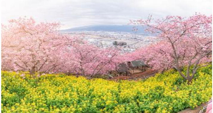
*** ระยะเวลาการบานของดอกไม้และซากุระจะขึ้นอยู่กับสายพันธุ์และสภาพอากาศ ***

กลางวัน รับประทานอาหารกลางวัน ณ ภัตตาคาร จากนั้นเดินทางสู่สถาน มัตสึดะ ซากุระ Matsuda Sakura Festival เทศกาลชมซากุระ ที่เมืองมัตสึดะ จังหวัดคานางาวะ ที่นี่มี คาวาชิซากุระ ปลูกทั่วบริเวณ เนินเขา สลับกับ ทุ่งดอกกะโนะฮานะ สีเหลืองอร่าม ทางสวนได้ทำเส้นทางได้ต้นซากุระไว้อย่างดีและปลอดภัย เด็กเล็กก็มาเที่ยวได้ และที่สำคัญ เรามีโอกาสได้เห็นฟูจิซัง ในวันฟ้าใสอีกด้วย