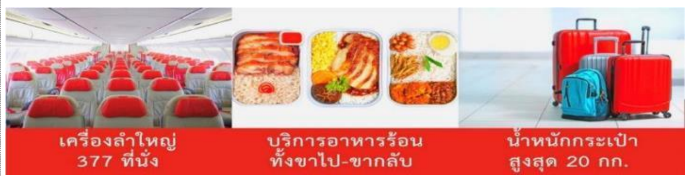
เครื่องลำใหญ่ 377 ที่นั่ง

*** หมายเหตุ : เคาน์เตอร์เช็คอินปิดบริการก่อนเวลาเครื่องออก 60 นาที และไม่มีประกาศเตือนผู้โดยสารขึ้นเครื่อง ดังนั้นผู้โดยสารจำเป็นต้องพร้อม ณ ประตูขึ้นเครื่องก่อนเวลาเครื่องออกอย่างน้อย 45 นาที *** สายการบิน AIR ASIA X ใช้เครื่อง AIRBUS A330-300 จำนวน 377 ที่นั่ง จัดที่นั่งแบบ 3-3-3 ตัวเครื่องบินเป็นตัวกรู๊ปสำหรับคณะทัวร์ ระบบของสายการบินจะทำการแรนดอมที่นั่ง ซึ่งไม่สามารถล็อกหรือเลือกกรู๊ปที่นั่งได้ หากลูกค้าต้องการเลือกกรู๊ปที่นั่ง ทางสายการบินมีบริการอัพเกรดที่นั่ง (ค่าบริการเป็นไปตามที่สายการบินกำหนด)