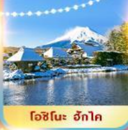
โคโนะ ฮักโค