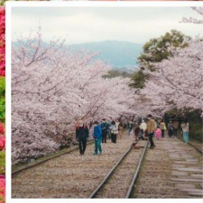
เคอะเกะ อินโคลน์