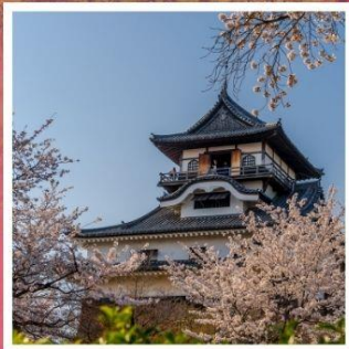
ปราสาทอินุยามะ