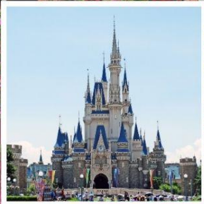
โตเกียว ดิสนีย์แลนด์ สวนฮานาโมโมะ โนะ ซาโตะ