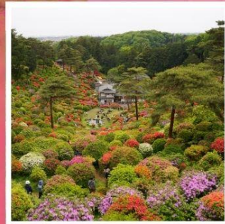
วัดชิโอะฟูเนะ คันบงจิ

โตเกียวดิสนีย์แลนด์ ดินแดนในฝันของคนทั้งโลก ฮานาโมโมะ โนะ ซาโตะ ดอกท้อกลางหุบเขาที่รอคุณมาเยือน ทางรถไฟสายเก่า เคอะเกะ อินโคลน์ 1 ในจุดชมซากุระที่สวยงามที่สุดแห่งเกียวโต ปราสาทอินุยามะ 1 ใน 12 ปราสาทดั้งเดิมกับทิวทัศน์อันแสนสวยงาม ขึ้นกระเช้าที่สูงที่สุดในญี่ปุ่น โคมากะทาเกะ กับแอ่งเทือกเขาสุดอัศจรรย์เช่นโจจิชิ เซอร์ค ชิโอะฟูเนะ คันบงจิ วัดแห่งดอกไม้สุด unseek ที่ไม่ควรพลาด พักออนเซ็น 2 คับ!!! // อาหารพิเศษ...บุฟเฟ่ต์บึงย่าง, บุฟเฟ่ต์ซาบู, บุฟเฟ่ต์ซาบู กรุ๊ปสบายๆ เพียง 20 ท่านเท่านั้น!!!