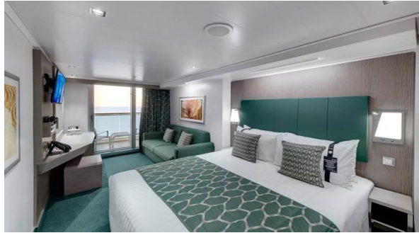
ห้องพักริมระเบียง Inside

ห้องพักริมระเบียงวิวทะเล (Ocean View with Balcony)