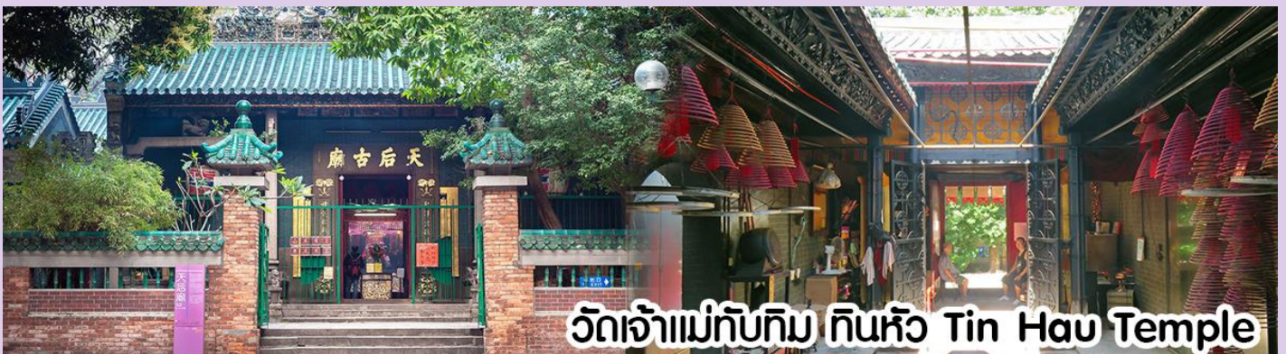
วัดเจ้าแม่ทับทิม ทินหัว Tin Hau Temple

นำทุกท่าน ไหว้ศาลเจ้าแม่ทับทิม ทินหัว (Tin Hau Temple) เป็นวัดเก่าแก่และสำคัญอีกวัดหนึ่งของฮ่องกง เพราะในสมัยก่อนฮ่องกงเป็นเพียงหมู่บ้านชาวประมง ซึ่งเคารพนักคือเจ้าแม่ทับทิมว่าเป็นเทพีแห่งท้องทะเล เพื่อให้เดินทางปลอดภัย เวลาออกไปทำงานไกลๆ หรือออกหาปลา นอกจากการมาสักการะบูชาเจ้าแม่ทับทิมในเรื่องของการเดินทางให้ปลอดภัยแล้ว ไฮไลท์สำคัญอีกอย่างหนึ่งของวัดเจ้าแม่ทับทิม ทินหัว (Tin Hau Temple) จะเป็นชุดรูปปั้นขนาดใหญ่ ที่แขวนอยู่ตามเพดานด้านในของวัดก็จะเป็นสถาปัตยกรรมแบบวัดจีน สร้างขึ้นตั้งแต่ปี ค.ศ. 1876 โดยทางเข้าของวัดจะอยู่ติดกับสวนสาธารณะเล็ก ๆ ที่มีต้นไม้ใหญ่หลายต้น ให้บรรยากาศร่มรื่น