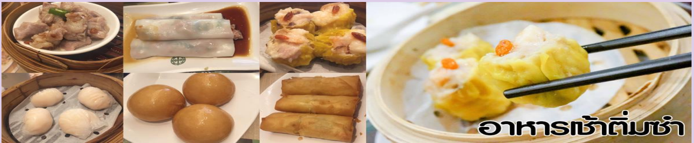
อาหารเช้าต้มซ่า

นำทุกท่าน ไหว้ศาลเจ้าแม่ทับทิม ทินหัว (Tin Hau Temple) เป็นวัดเก่าแก่และสำคัญอีกวัดหนึ่งของฮ่องกง เพราะในสมัยก่อน ฮ่องกงเป็นเพียงหมู่บ้านชาวประมง ซึ่งเคารพนักคือเจ้าแม่ทับทิมว่าเป็นเทพีแห่งท้องทะเล เพื่อให้เดินทางปลอดภัย เวลาออกไปทำงานไกลๆ หรือออกหาปลา นอกจากการมาสักการะบูชาเจ้าแม่ทับทิมในเรื่องของการเดินทางให้ปลอดภัยแล้ว ไฮไลท์สำคัญอีกอย่างหนึ่งของวัดเจ้าแม่ทับทิม ทินหัว (Tin Hau Temple) จะเป็นชุดรูปสี่แดงขนาดใหญ่ ที่แขวนอยู่ตามเพดานด้านในของวัดก็จะเป็นสถาปัตยกรรมแบบวัดจีน สร้างขึ้นตั้งแต่ปี ค.ศ. 1876 โดยทางเข้าของวัดจะอยู่ติดกับสวนสาธารณะเล็ก ๆ ที่มีต้นไม้ใหญ่หลายต้น ให้บรรยากาศร่มรื่น