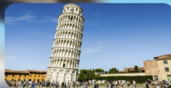
หอเอนปีซ่า