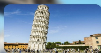
ทาวน์ปีซ่า