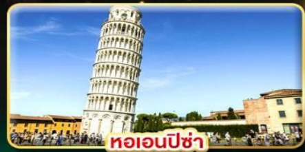
หออนพีซ่า