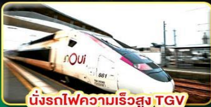
นั่งรถไฟความเร็วสูง TGV