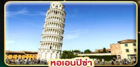
หออนพีซ่า