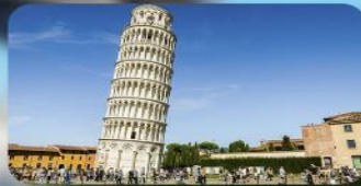
หอเอนปิส่า