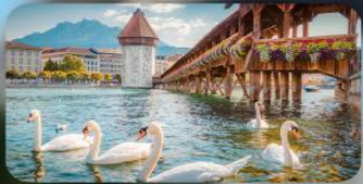
สะพานไม้ซาเปิล