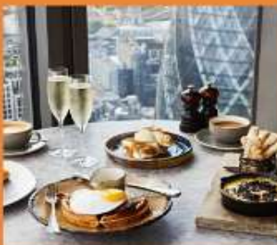
DUCK AND WAFFLE