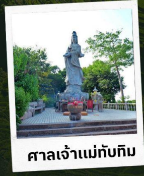
ศาลเจ้าแม่ทับทิม