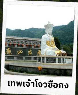
เทพเจ้าโจวซือกง