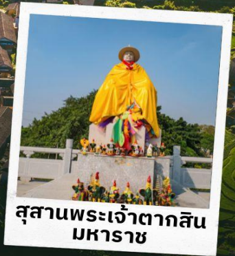
สุสานพระเจ้าตากสิน มหาราช