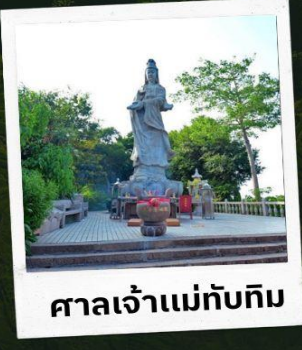
ศาลเจ้าแม่ทับทิม