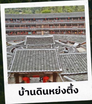
บ้านดินหย่งตั้ง