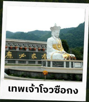
เทพเจ้าโจวซือกง