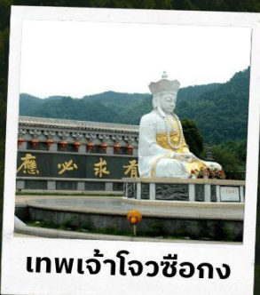
เทพเจ้าโจวซือกง