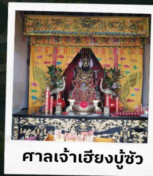
ศาลเจ้าเฮียงบู๊ซัว