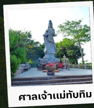
ศาลเจ้าแม่ทับทิม