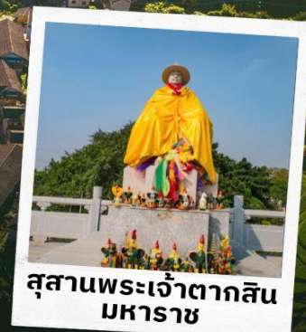
สุสานพระเจ้าตากสิน มหาราช