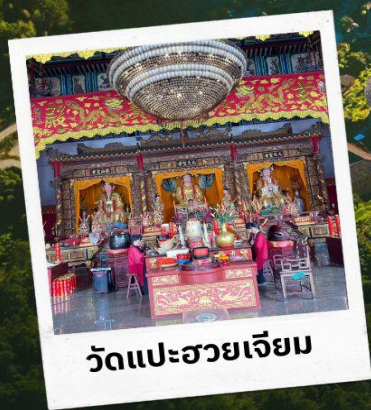
วัดแปะฮวยเจียม