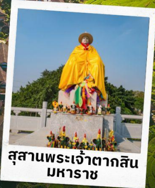
สุสานพระเจ้าตากสิน มหาราช