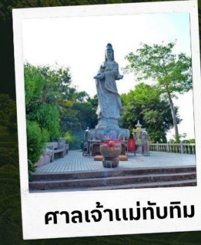
ศาลเจ้าแม่ทับทิม