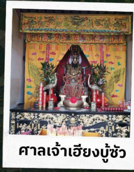
ศาลเจ้าเอียงบู๊ซัว