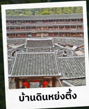
บ้านดินหย่งตั้ง