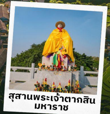
สุสานพระเจ้าตากสิน มหาสาร