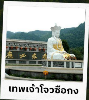
เทพเจ้าโจวซือกง