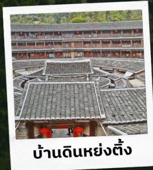
บ้านดินหย่งตั้ง