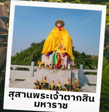
สุสานพระเจ้าตากสิน มหาราช