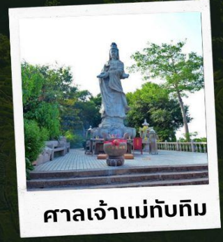
ศาลเจ้าแม่ทับทิม