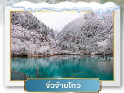
จิวจ้ายโกว