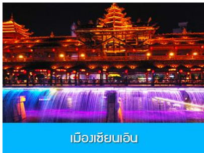
เมืองเซียนเอิน