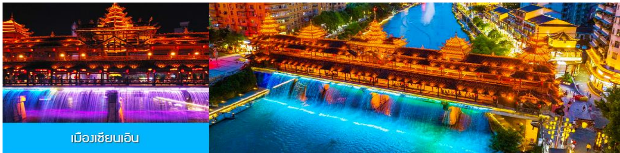
เมืองชียนเอิน