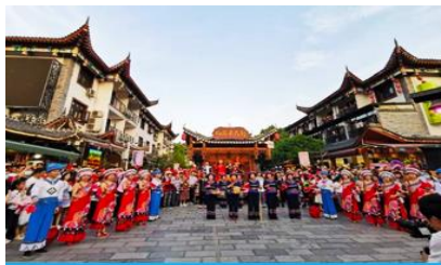
เมืองเทพธิดา