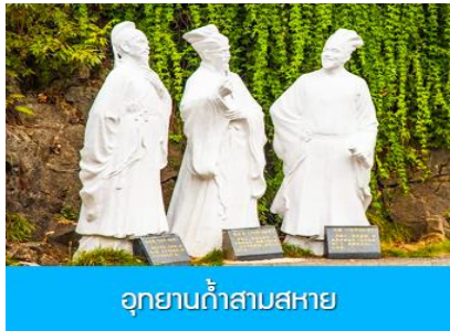
อุทยานถ้ำสามสหาย