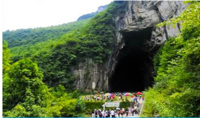
ถ้ำผญามังกร

พักที่ YICHANG HUIHAO HOTEL โรงแรมระดับ 4 ดาวหรือเทียบเท่าในเมืองหยี่ซัง