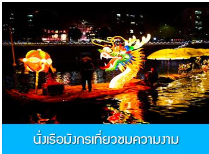
นั่งเรือมังกรเที่ยวชมความงาม