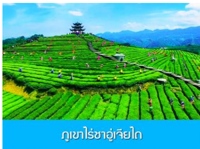
ภูเขาไร่ชาอู่เจียโก

พักที่ โรงแรม ENSHI XIPU HOTEL ระดับ 4 ดาวห้องดินหรือเทียบเท่าในเมืองเอนซือ