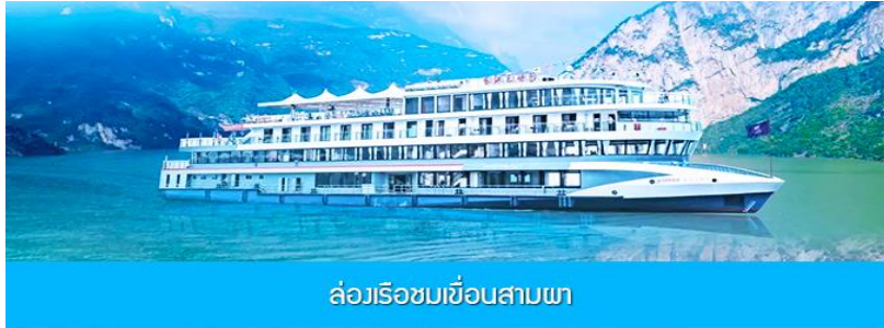
ล่องเรือชมเขื่อนสามผา