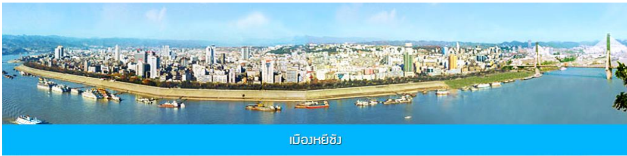
เมืองหยี้ชัง