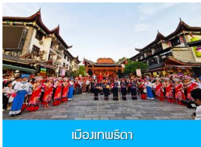
เมืองเทพริดา