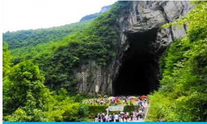
ถ้ำพญามังกร