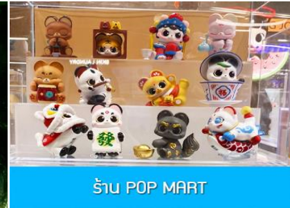
ร้าน POP MART

วันที่ห้า เมืองเอินซือ – อุทยานตี้ซินกู่ (โกรกหัวใจ) – เมืองหยีซัง – ซ้อปิ้งย่าน CBD – POP MART