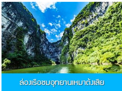
ล่องเรือชมอุทยานเหมาดังเสียดี