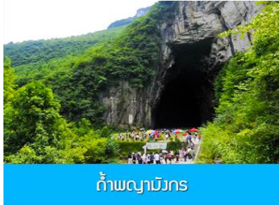
ถ้ำผญามังกร

พักที่ YICHANG HUIHAO HOTEL โรงแรมระดับ 4 ดาวหรือเทียบเท่าในเมืองหยีซัง