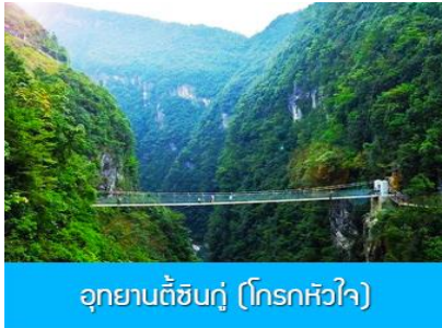
อุทยานตี้ซินกู่ (โกรกหัวใจ)

พักที่ โรงแรม ENSHI XIPU HOTEL ระดับ 4 ดาวท้องถิ่นหรือเทียบเท่าในเมืองเอินซือ