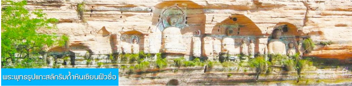
พระพุทธรูปแกะสลักริมถ้ำหินเซียนฝิวซื่อ

นำท่านเดินทางสู่อุทยาน เหมาดังเสี่ย 来凤卯洞峡 นำท่านล่องเรือที่วิวชมทัศนียภาพและความสวยงามของช่องแคบเหมาดังเสี่ย สายน้ำสีมรกตที่ไหลคดเคี้ยวไปตามช่องแคบระหว่างหน้าผาสูงชันและภูเขา ผ่านถ้ำน้อยใหญ่หลายแห่งที่เคยเป็นที่ซ่อนตัวของโจรที่หลบหนีการตามล่าของทางการ (ใช้เวลาล่องเรือประมาณ 45 นาที)