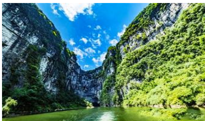
ล่องเรือชมอุทยานเหมาดังเสี่ย