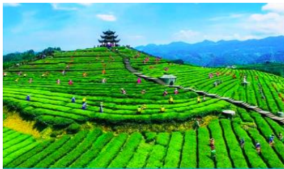
ภูเขาไร่ชาอู่เจียโก

พักที่ โรงแรม ENSHI XIPU HOTEL ระดับ 4 ดาวห้องดีนหรือเทียบเท่าในเมืองเอนซือ