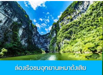
ล่องเรือชมอุทยานเหมาดังเสี๋ย