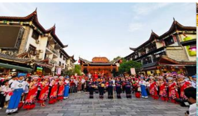
เมืองเทพริดา