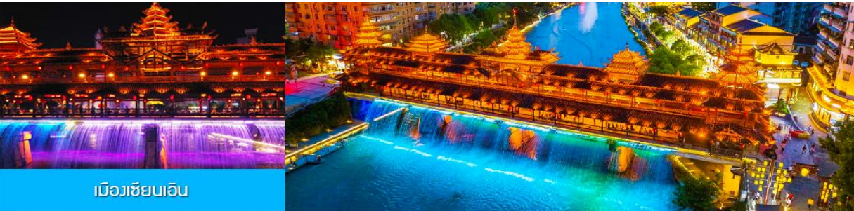
เมืองชียนเอิน