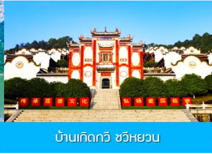
บ้านเกิดกวี ขวี่หยวน