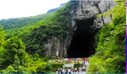
ถ้ำผญามังกร

พักที่ YICHANG HUIHAO HOTEL โรงแรมระดับ 4 ดาวหรือเทียบเท่าในเมืองหยีซัง