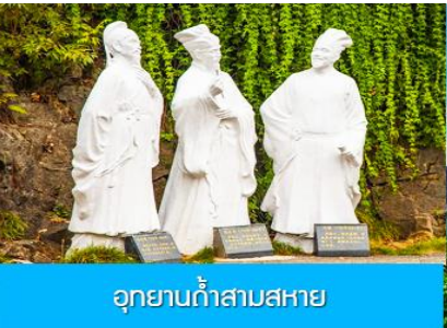
อุทยานถ้ำสามสหาย