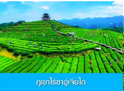
ภูเขาไร่ชาฉู่เจียไถ

พักที่ โรงแรม ENSHI XIPU HOTEL ระดับ 4 ดาวห้องดินหรือเทียบเท่าในเมืองเินซือ