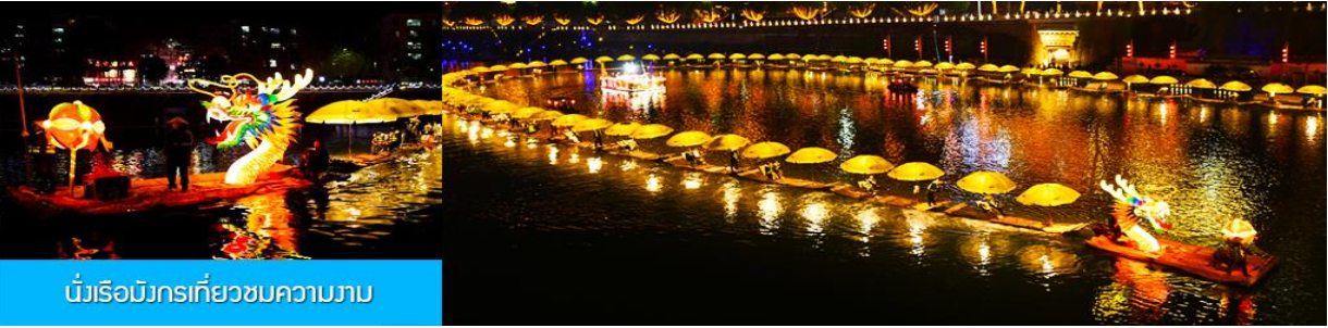
บัวเรือมังกรเที่ยวชมความงาม

หลังอาหารนำท่านเดินทางเข้าที่พัก หรือท่านสามารถเลือกซื้อโปรแกรมเสริม เป็นตัวนั่งเรือมังกรเที่ยวชมความงามของบ้านเรือนและสิ่งปลูกสร้างสองฝั่งแม่น้ำในช่วงที่สวยงามที่สุดของเมือง เซียนเอิน ที่ประดับประดาด้วยแสงสี และได้ชื่อว่าเป็นวิวยามค่ำคืนที่สวยงามที่สุดในมณฑลหูเป่ย์ เช่นเดียวกับเมืองโบราณฟงหวงในมณฑลหูหนาน.....อัตราค่าบริการสำหรับโปรแกรมเสริมนั่งเรือมังกรชมวิวยามค่ำคืน ท่านละ 190 หยวน หรือ 950 บาท ระยะเวลาที่ใช้ในการเรือมังกร ประมาณ 45 นาที ค่าบริการรวม ค่าบัตรเข้าชม ค่ารถรับ ส่ง และค่าน้ำเที่ยวของไกด์ท้องถิ่น