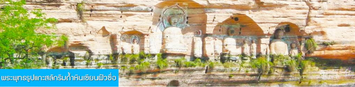
พระพุทธรูปแกะสลักหินถ้ำหินเซียนฝิวซื่อ

นำท่านเดินทางสู่อุทยาน เหมาดังเสี่ย 来凤卯洞峡 นำท่านล่องเรือที่วิวชมทัศนียภาพและความสวยงามของช่องแคบเหมาดังเสี่ย สายน้ำสีมรกตที่ไหลคดเคี้ยวไปตามช่องแคบระหว่างหน้าผาสูงชันและภูเขา ผ่านถ้ำน้อยใหญ่หลายแห่งที่เคยเป็นที่ซ่อนสมของโจรที่หลบหนีการตามล่าของทางการ (ใช้เวลาล่องเรือประมาณ 45 นาที)