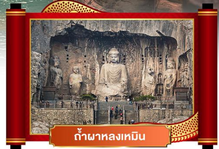
ถ้ำผาหลงเหมิน