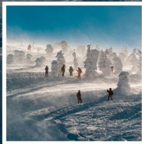
กระเช้าลอยฟ้าซาโอะ