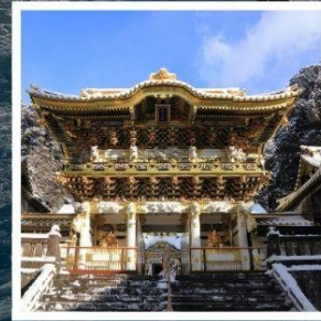
ศาลเจ้าโทโชกุ