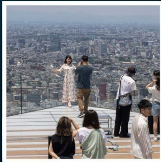
ชิบูย่า สกาย