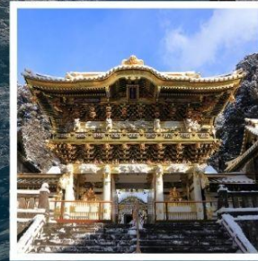
ศาลเจ้าโทโชกุ