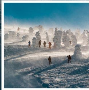
กระเช้าลอยฟ้าซาโอะ