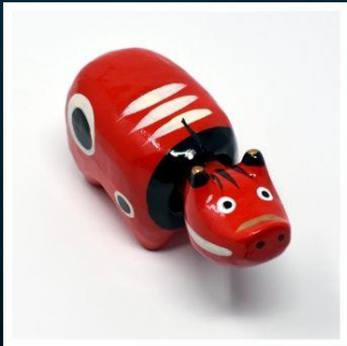
กิจกรรมตุ๊กตาอากะเบโกะ