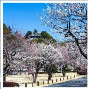
สวนโคระคุเอ็น