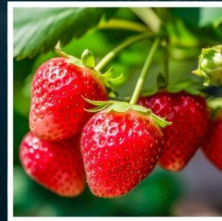
เก็บสตอร์วเบอร์รี่

เหล่าดอกไม้บานสะพรั่งกลางสวนโคระคุเอ็น สวนที่สวยงามที่สุด 1 ใน 3 ของญี่ปุ่น ชมปรากฏการณ์สุดแปลกตา ปีศาจหิมะ จูเฮียว บนกระเช้าซาโอะ ศาลเจ้ามรดกโลก นิกโกโทโชกุ ความปราณีตและประวัติศาสตร์อันน่าทึ่ง สัมผัสประสบการณ์ทาสี ตุ๊กตาวิวดวง เครื่องรางแห่งสุขภาพที่ไม่ควรพลาด ชิบูย่าสกาย ดาดฟ้าที่เป็นไวรอลที่สุดแห่งโตเกียว กิจกรรมเก็บสตอร์วเบอร์รี่แสนอร่อย พักออนเซ็น 2 คั้น!!! // อาหารพิเศษ...บุฟเฟ่ต์ปิ้งย่าง, บุฟเฟ่ต์ชาบู กรุ๊ปสบายๆ เพียง 20 ท่านเท่านั้น!!!