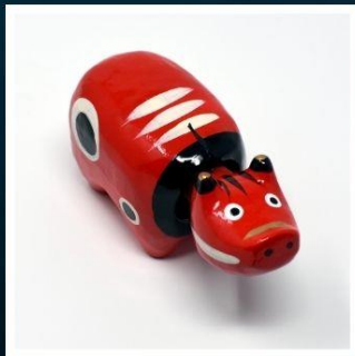
กิจกรรมตุ๊กตาอากะเบโกะ