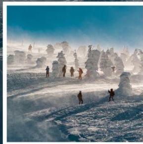
กระเช้าลอยฟ้าซาโอะ