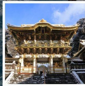
ศาลเจ้าโทโชกุ