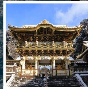
ศาลเจ้าโทโชกุ