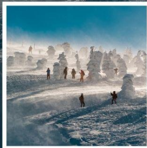
กระเช้าลอยฟ้าซาโอะ