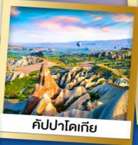
คัปปาโดเกีย