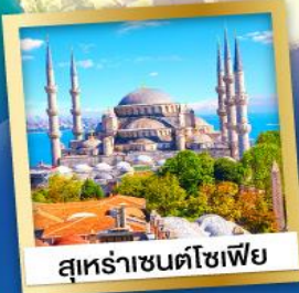
สุทราซันตโซเฟีย