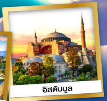
อิสตันบูล