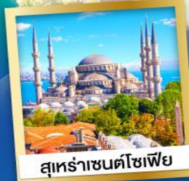
สุทราซันตโซเฟีย