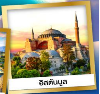
อิสตันบูล