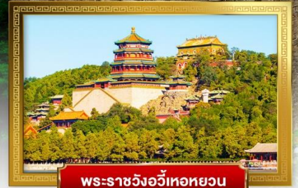
พระราชวังอู่โต๋หยวน