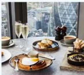
DUCK AND WAFFLE