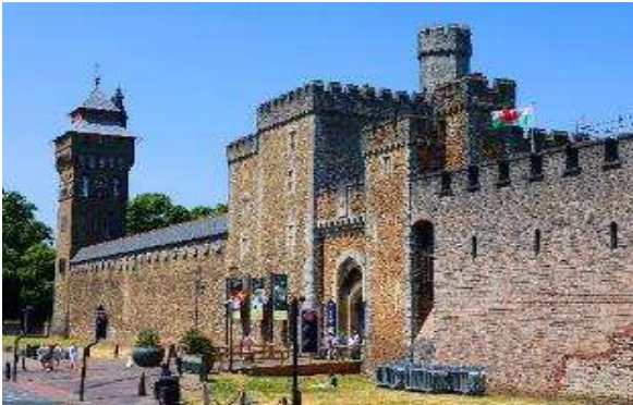
หลวงของเวลส์ อดีตเป็นเมืองที่ส่งออกถ่านหินมากที่สุดเมืองหนึ่ง ชมศาลาว่าการเมือง (City Hall) จากนั้นนำเก็บภาพปราสาทคาร์ดิฟ (Cardiff Castle) (ภายนอก)